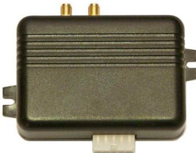
Рис. 1. Общий вид терминала.

Передача данных возможна только при наличии сети сотовой связи стандарта GSM 900/1800 поддерживающей услугу пакетной передачи данных (GPRS).